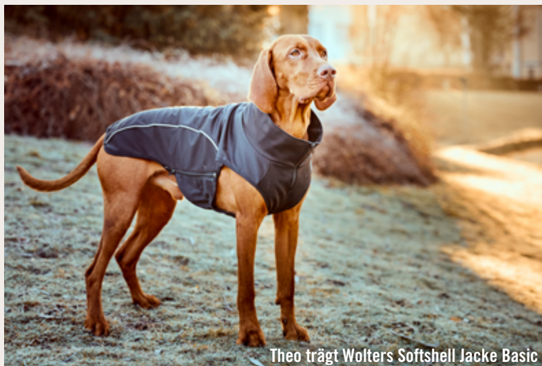
Theo trägt Wolters Softshell Jacke Basic