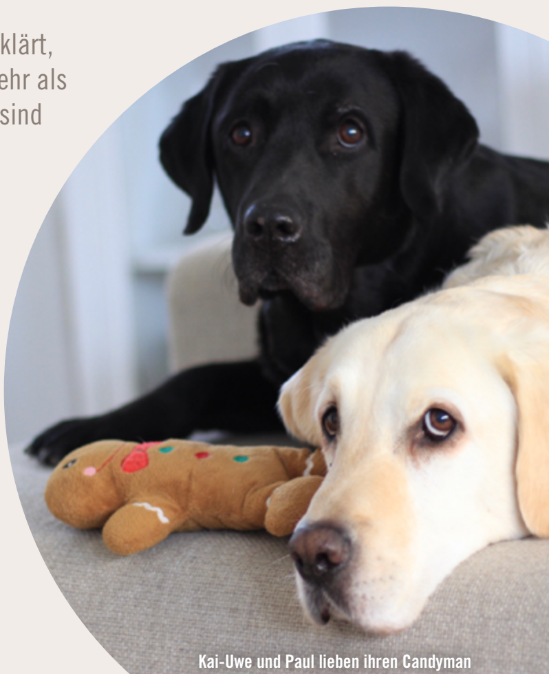
Kai-Uwe und Paul lieben ihren Candyman