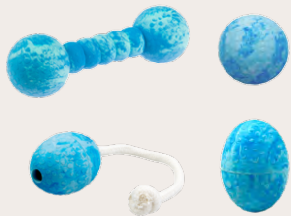
Spielzeug aus Naturkautschuk: Aqua-Fun Ball, Aqua-Fun Gym, Straußenei, Bite-Me Collection Bouncer UVP: ab 4,99 EUR