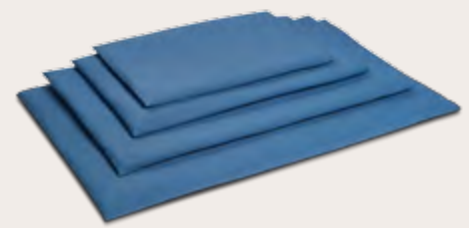
To Go Reise Pad Vier Größen UVP: ab 22,99 EUR