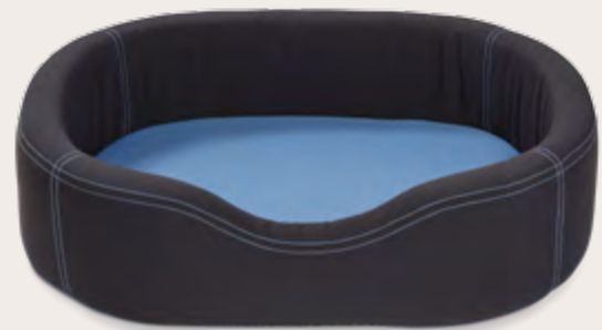
VIP Nylon Lounge Vier Größen UVP: ab 69,99 EUR