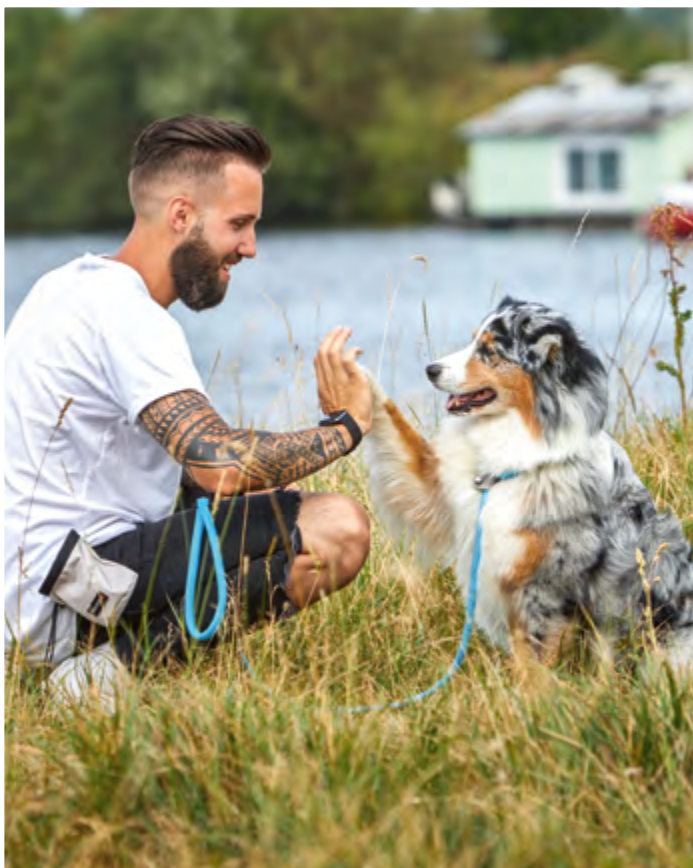
K2 Taugprogramm Schlupfhalsband, Führleine, Moxonleine Viele verschiedene Größen UVP: ab 9,99 EUR