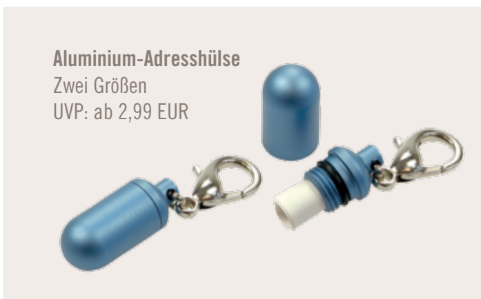
Aluminium-Adresshülse Zwei Größen UVP: ab 2,99 EUR