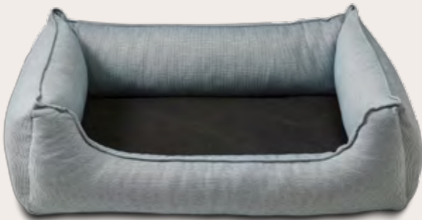
Noble Stripes Hundebett Drei Größen UVP: ab 54,99 EUR